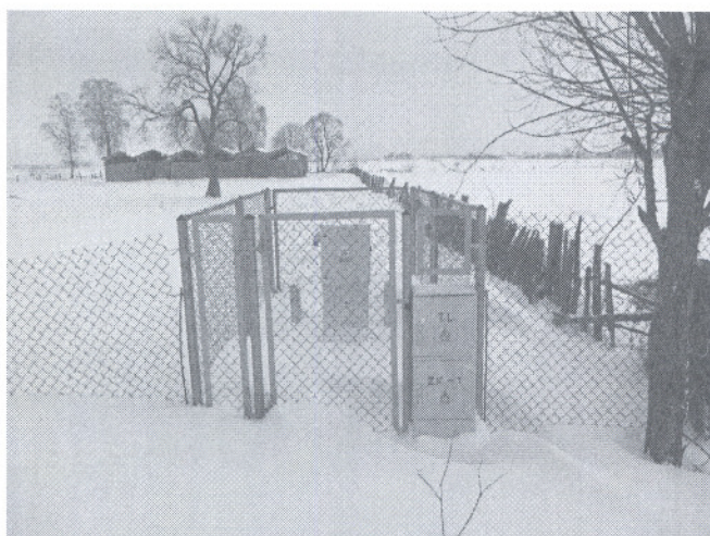
Przepompownia ścieków w m. Jagodniki, z której ścieki tłoczone są na oczyszczalnię