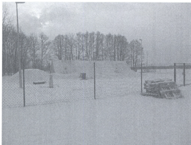
Oczyszczalnia ścieków w m. Stary Kornin