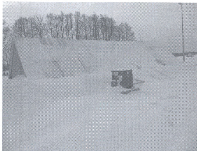
Reaktor biologiczny i zbiornik osadu nadmiernego, z przodu dmuchawa do napowietrzania ścieków (Oczyszczalnia ścieków w m. Stary Kornin)