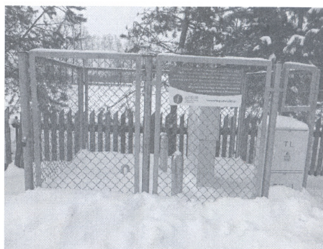
Przepompownia ścieków w m. Jagodniki, do której wpływają ścieki z kanalizacji grawitacyjnej