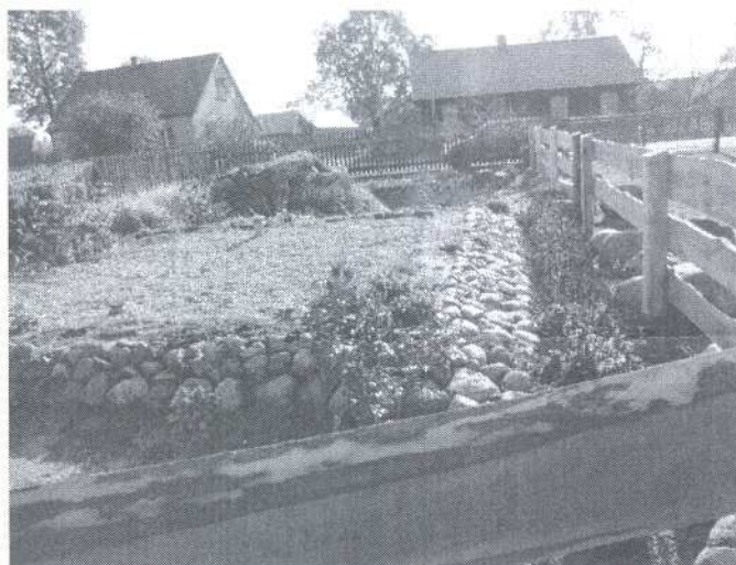
Oczyszczalnia przydomowa w m. Jelonka 16