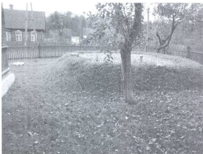
Oczyszczalnia przydomowa w m. Wiluki 10