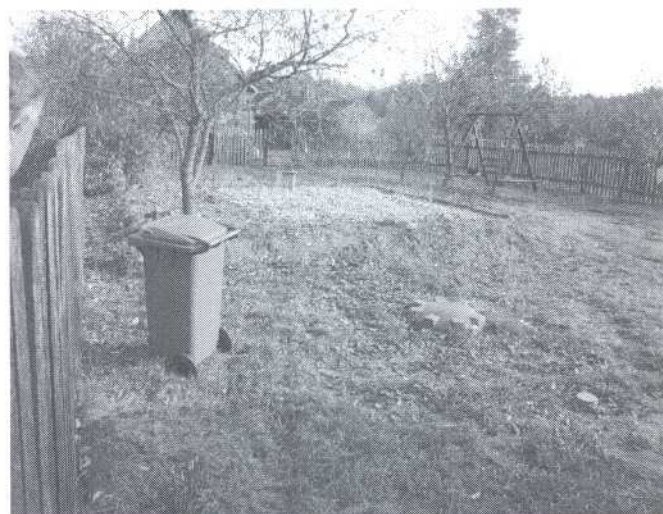
Oczyszczalnia przydomowa w m. Kraskowszczyzna 4