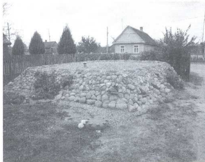
Oczyszczalnia przydomowa w m. Istok 25