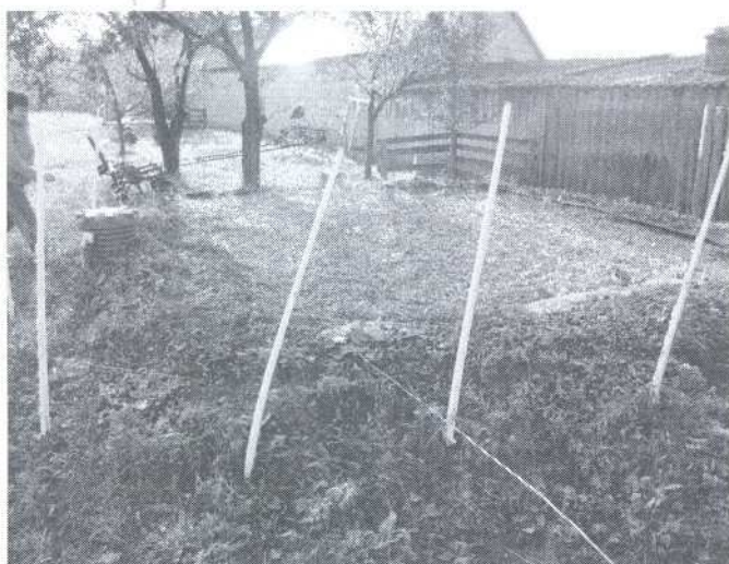
Oczyszczalnia przydomowa w m. Jelonka 39