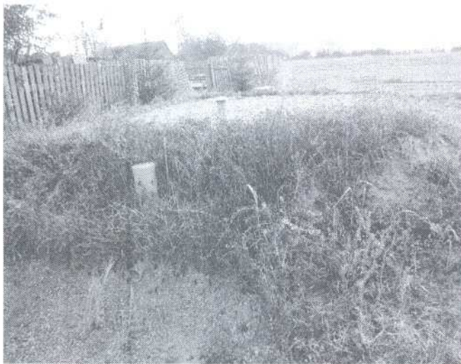
Oczyszczalnia przydomowa w m. Witowo 20