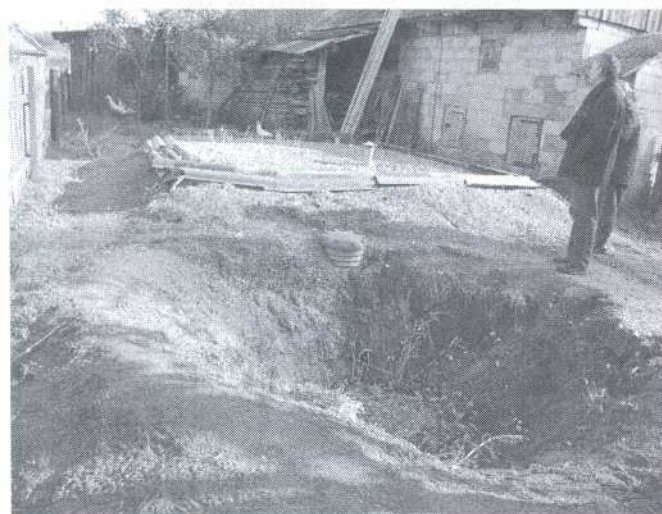
Oczyszczalnia przydomowa w m. Kraskowszczyzna 1