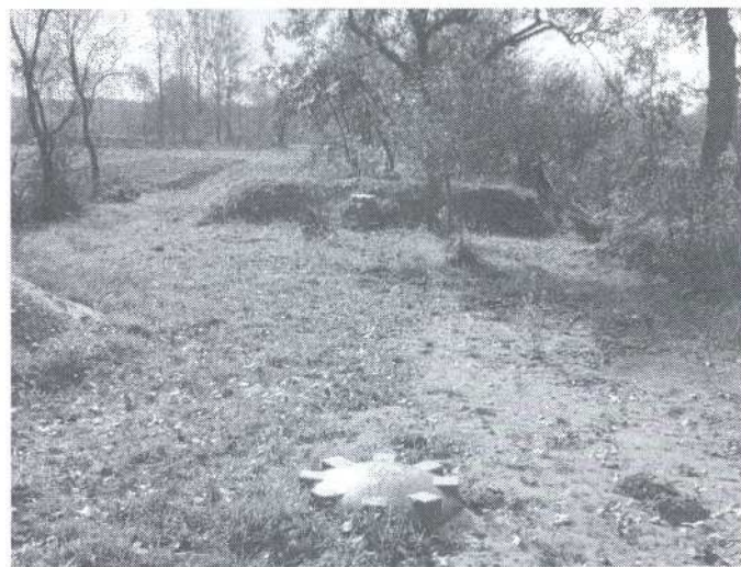
Oczyszczalnia przydomowa w m. Długi Bród 25