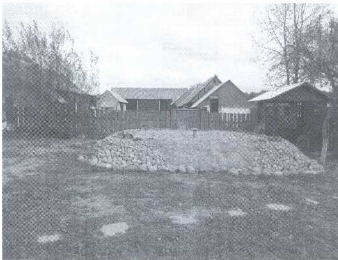
Oczyszczalnia przydomowa w m. Istok 41