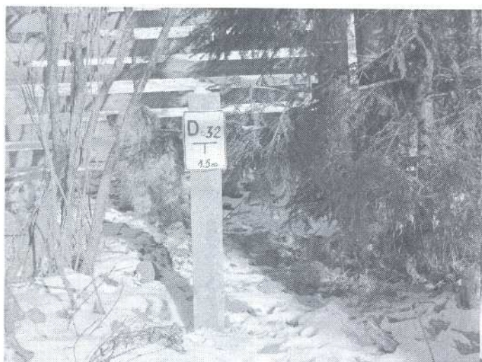
9. Tabliczka informacyjna o lokalizacji zasuw Na przyłączy