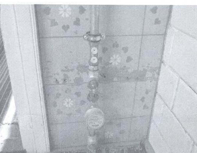
10. Zestaw wodomierzowy