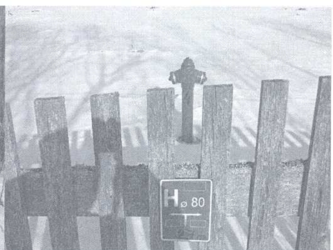
5 i 6. Hydranty we wsi Nikiforowszczyzna