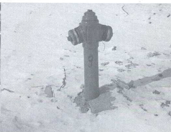
7 i 8. Hydranty we wsi Wygon