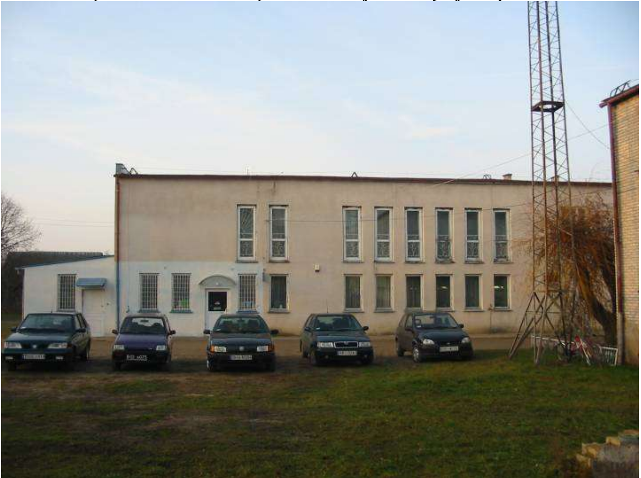
ZDJĘCIE STANU ISNIEJĄCEGO- wido od tyłu budynku