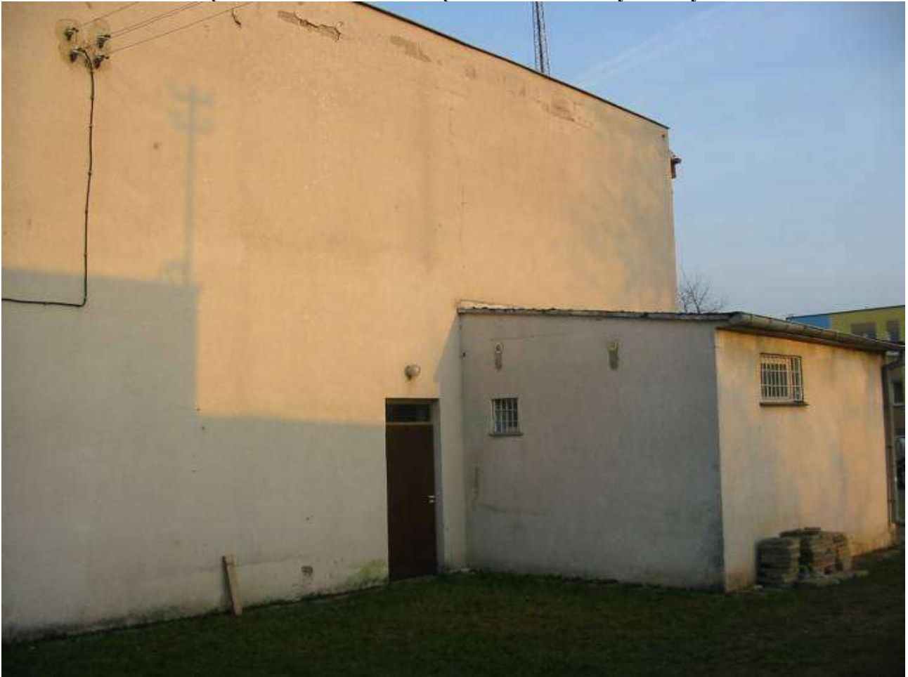
ZDJĘCIE STANU ISNIEJĄCEGO- elewacja od strony tyłu OSP elewacja półn.-zach.