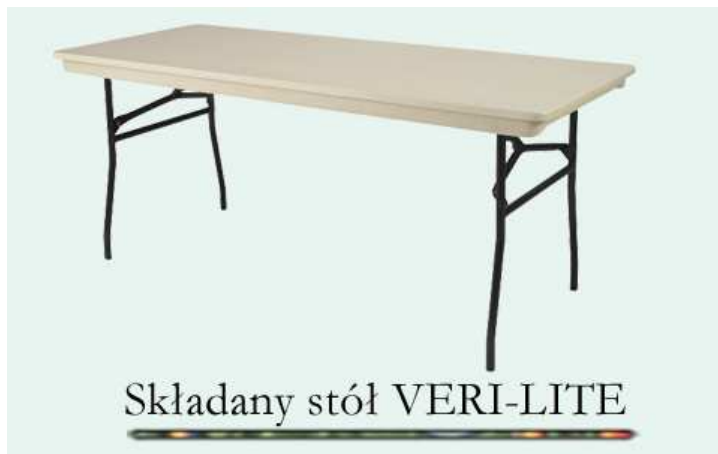
Składany stół VERI-LITE