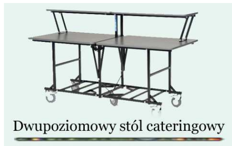
Dwupoziomowy stół cateringowy

Kolor: beż, ISO 9001: 2000 Gwarancja: 5 lat